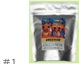
#1 ケニア有機無農薬紅茶 ティーバッグ(2gx20)40g