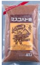
#3 ネグロス マスコバド糖(黒砂糖) 500g