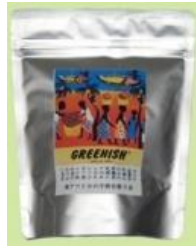
#1 ケニア有機無農薬紅茶ティーバッグ(3gx20)60g